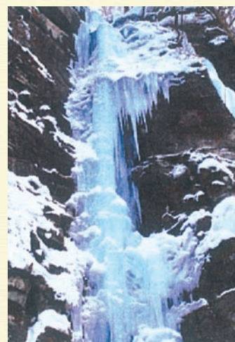
雪景色と氷柱の奥入瀬渓流